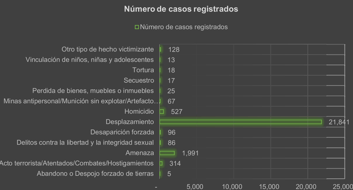
Figura 1. Hechos victimizantes sufridos por NNA víctimas con discapacidad

Según las cifras, el desplazamiento constituye el principal hecho victimizante. De igual modo, los registros sobre desplazamiento forzado muestran que en más de la mitad de los casos los NNA deben salir de sus lugares de origen por amenazas a su vida e integridad y se desplazan junto con sus familiares o adultos cuidadores principalmente a cinco departamentos: Antioquia, Cundinamarca (Bogotá), Nariño, Cauca y Valle del Cauca (Centro Nacional de Memoria Histórica [CNMH] & UNARIV, 2015). En esta dinámica, como parte de la búsqueda de opciones y posibilidades en otras ciudades, muchos de estos NNA son matriculados en instituciones educativas (IE) para integrarlos nuevamente o por primera vez al sistema escolar.