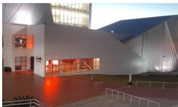
Figura 3. Biblioteca Univates, Lajeado

Antes de hablar de mis aprendizajes, cabe señalar que la Univates es una universidad Privada, nueva en el proceso de inclusión, cuenta con la tercer mejor biblioteca del país, su infraestructura está adaptada para las PcD.