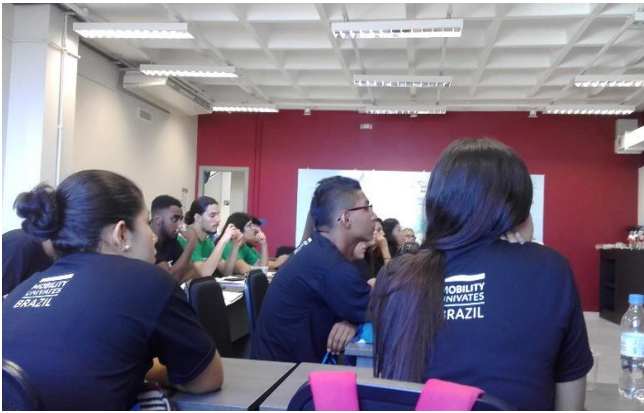
Figura 12. Primer acercamiento con intercambistas de los países de Colombia, Argentina, Perú, México, Suiza y Chile. Centro cultural Lajeado