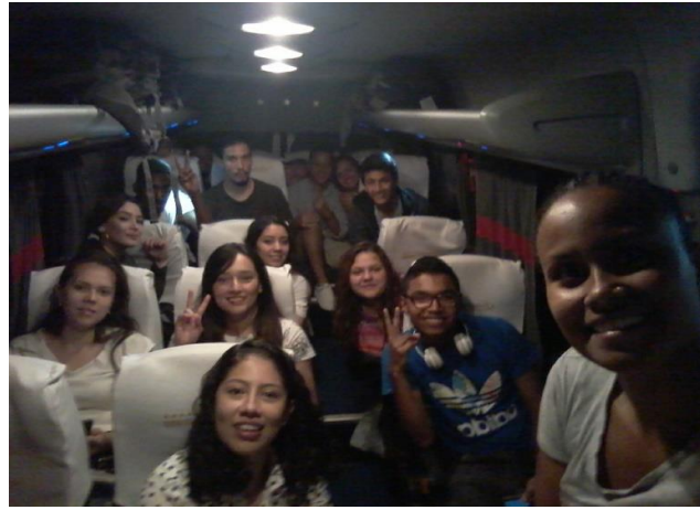
Figura 7. Experiencias inolvidables, Florianópolis