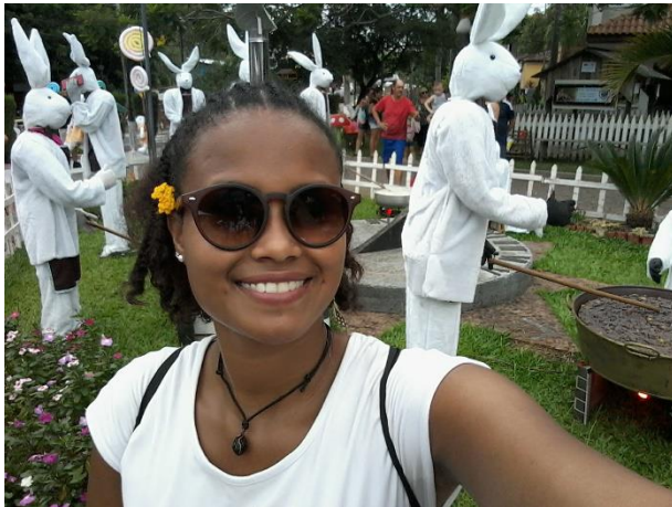
Figura 8. Día de pascua, Colinas