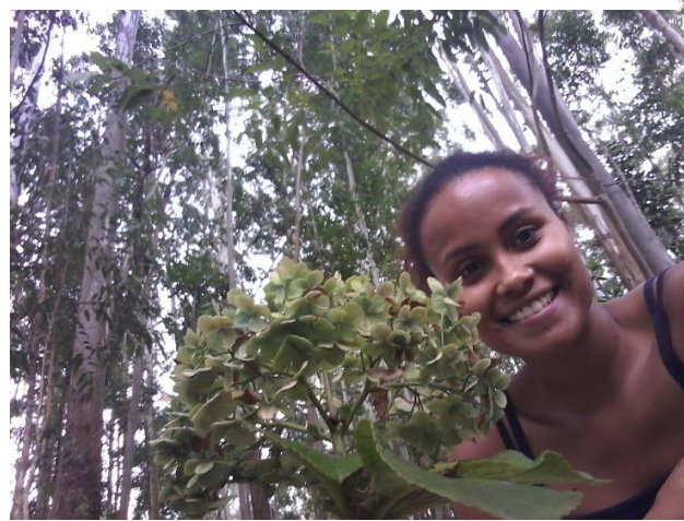
Figura 11. Un poco de naturaleza, Capitão