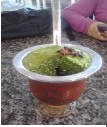
Figura 4. Chimarrão, Lajeado

Lajeado es una ciudad pequeña fue conquistada por alemanes e italianos, por lo cual se habla alemán e italiano, es tranquila, tradicionalmente el plan de semana consiste en beber chimarrão que es una bebida típica de la región.