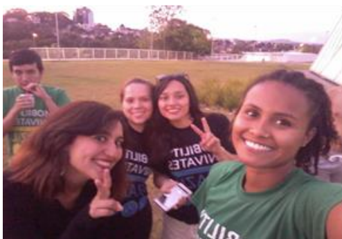
Figura 2. Centro Cultural, Lajeado

que he vivido mi vida entera, rodeado de una cultura, un idioma y enfrentarme a unas personas totalmente desconocidas, al momento de enfrentarme a todo esto, tuve que jugar con el contexto para defenderme y adaptarme a ellos, y sin duda lo he logrado y eso me genera satisfacción, debido a que no es fácil hacerlo en tan poco tiempo, en el camino se me han presentado múltiples obstáculos pero los he sabido afrontar con responsabilidad y madurez.