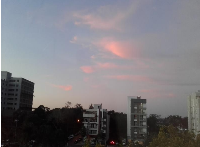
Figura 15. Nuevas perspectivas, Lajeado