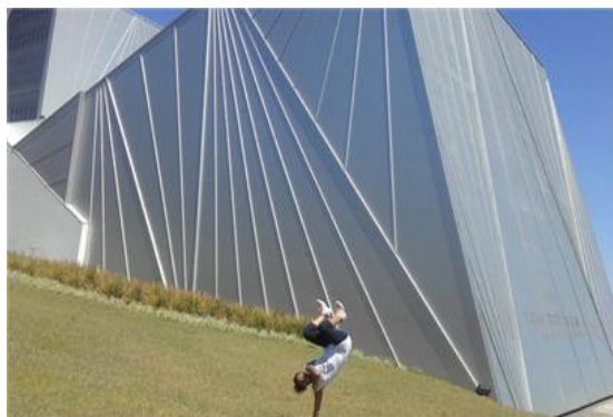
Figura 1. Centro Cultural, Univates

En mi opinión, me es importante aprovechar todo tipo de oportunidades que se presenten para contribuir a mi crecimiento personal, académico y también laboral, sin importar las adversidades que se tengan que vivir, ya que desde el momento en que ingresé a la UPN desde un principio siempre me propuse obtener el más alto promedio, sobresaliendo, dejando una imagen y una enseñanza de “qué si lo quieres lo logras”. De este modo me proyecté a realizar un intercambio fuera del país, con el propósito de conocer e