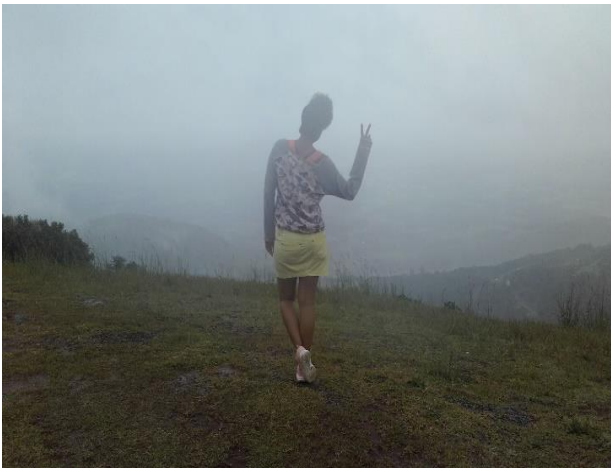
Figura 10. Nuevos retos, Teutónica