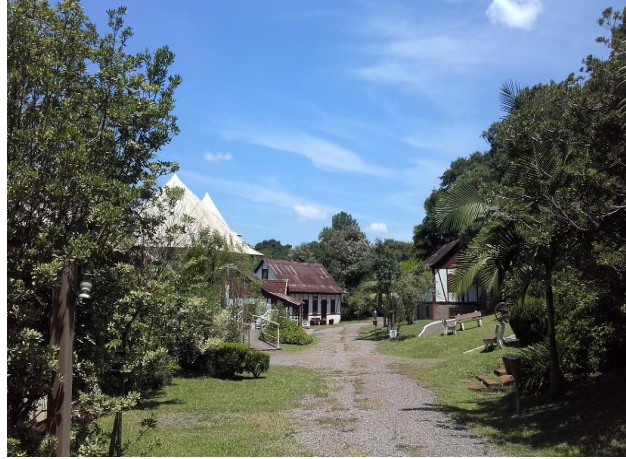
Figura 9. Parque Histórico, Lajeado