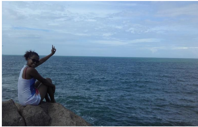
Figura 13. Encuentro conmigo misma, Florianópolis