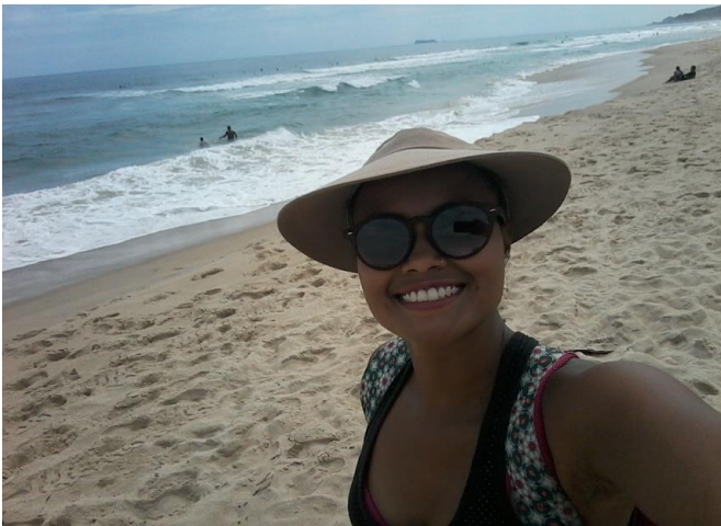
Figura 14. Nuevas culturas, Florianópolis